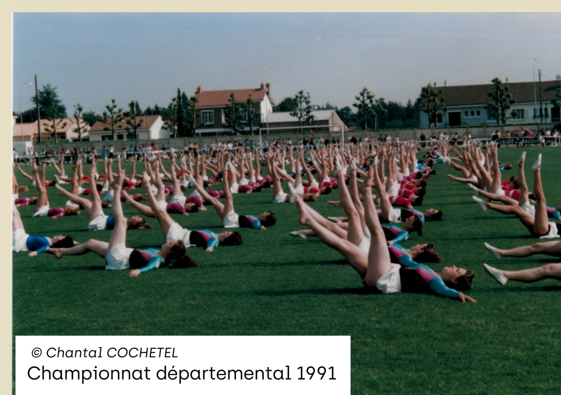
© Chantal COCHETEL Championnat départemental 1991

En 1943 les sections d'haltérophilie, d'équilibristes-acrobates et de ping-pong sont créées au sein du patronage. Puis viennent à partir de 1950, le basket, les sports nautiques dans la Sèvre, les jeux de boules. La section gym masculine redémarre en 1952 sous l'impulsion d'un abbé accompagné des moniteurs Jean GAUDIN et Robert BROSSEAU.