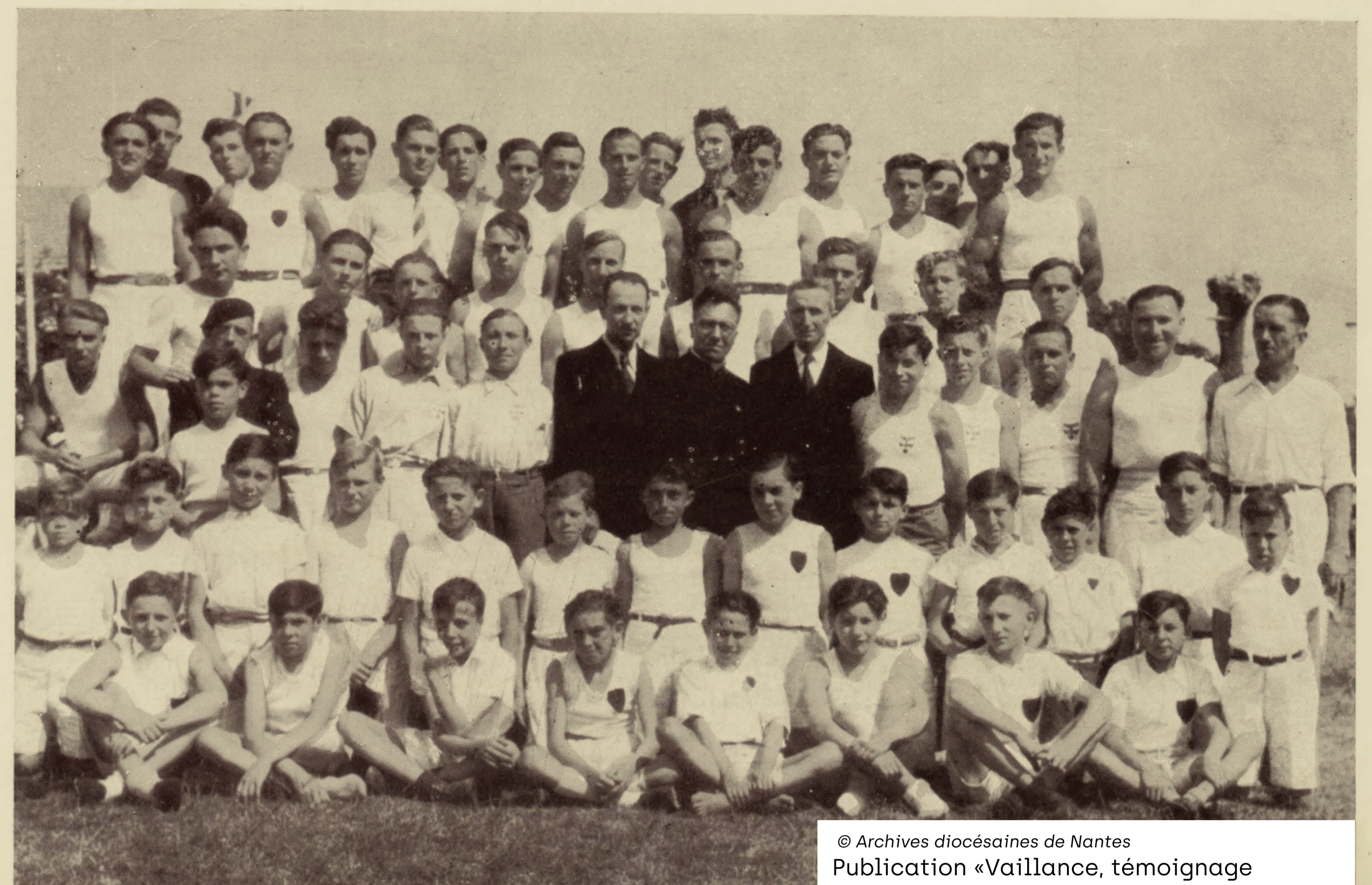
Publication «Vaillance, témoignage d'activité du Patronage de Vertou 1940-1945»